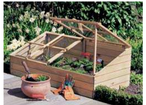
Kleine Frühbeet-Kästen aus Holz oder Kunststoff sind auch im Gartenfachhandel erhältlich

Ein Frühbeet-Kasten aus Holz hat den Vorteil, dass man ihn nach der Anzucht-Saison einfach abbauen und bis zum nächsten Frühjahr im trockenen Schuppen lagern kann. Massive Frühbeete, beispielsweise aus Klinker-Mauerwerk, halten viel länger, aber ihr Standort will wohlüberlegt sein, da sie sich nicht einfach versetzen lassen. Wer möchte, kann den Deckel mit einem automatischen Fensterheber ausstatten, wie man ihn von Gewächshausfenstern kennt. Die Flüssigkeit im Inneren des Druckzylinders dehnt sich bei höheren Temperaturen aus und öffnet dabei die Abdeckung, so dass frische Luft einströmen kann.